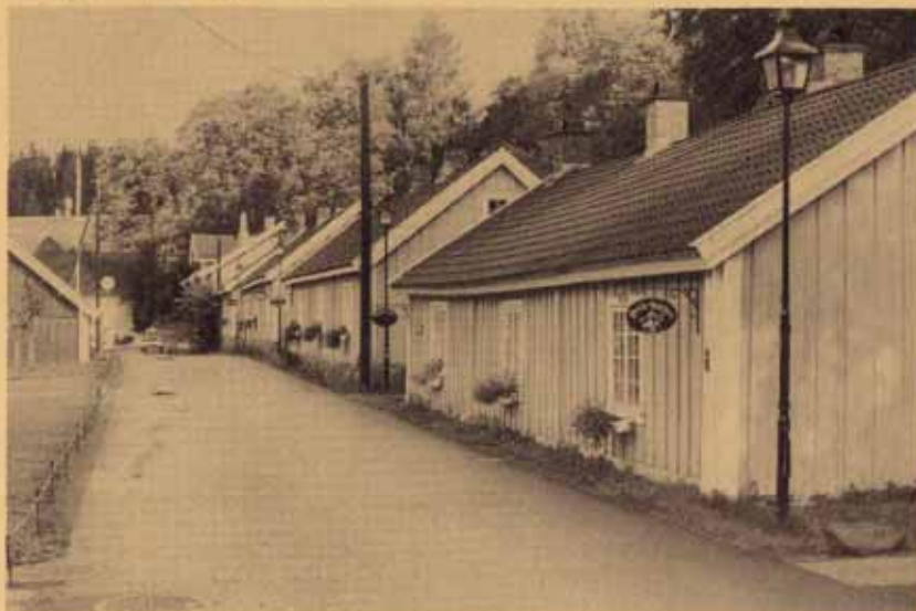
Gata slik den er idag.

Idag er det slutt, men Bærumsverket lever likevel, ikke minst på grunn av boligreisingen på Toppenhaug, Helset, Sleiverud og Gullhaug. Takket være den gradvise avviklingen av virksomheten på verket, finner vi fremdeles mange av de gamle bygningene på de gamle tomtene. Fire av husene på verket