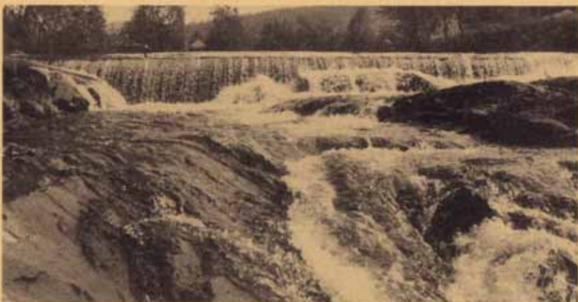
Fossen på Bærumsverket som en gang var den viktigste kraftkilden.

over ubøyelighet eller hårdhet fra deres side. De forsyner oss med arbeid og selger oss korn til rimelig pris slik at vi med takknemlighet erkjenner de goder vi har fremfor mange andre», heter det i en uttalelse fra foreningen på Bærumsverket sommeren 1850. Nå betyr jo ikke dette at alt var idyll i Verks-gata, og foreningen antyder til slutt at det nok er ting som burde endres.