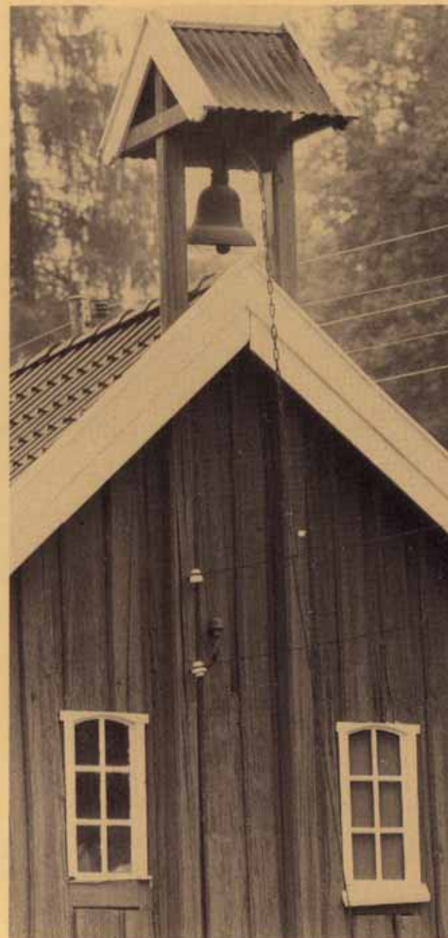
Klokkebua fra 1800 med verksklokken som ringte til arbeid og fest, i sorg og glede. En gang var det handel i bua.